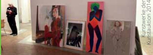
Kunstwerke der Kunstauktion 2014