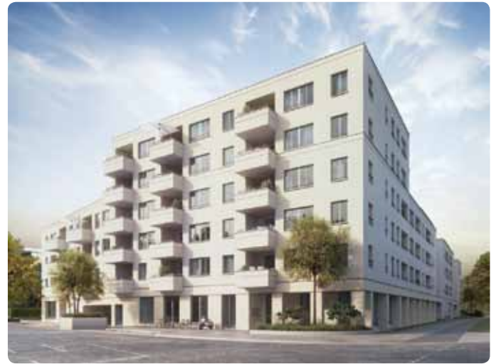
Fotorealistische Darstellung